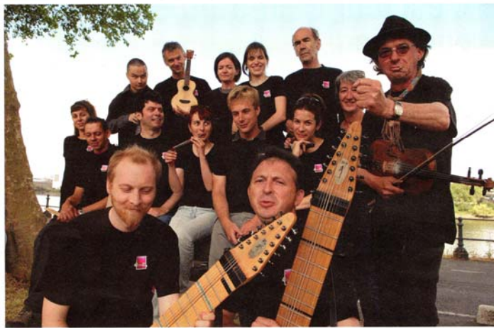
4par2 = 6 formations musicales réunies dans un collectif.