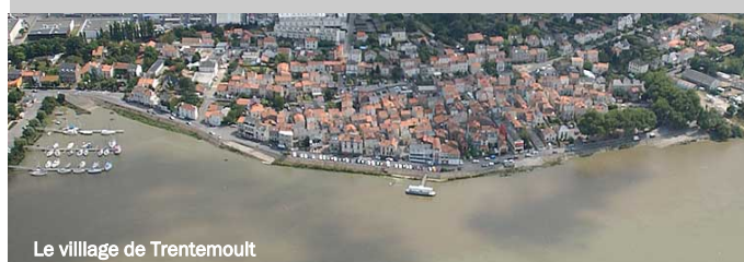
Le village de Trentemoult